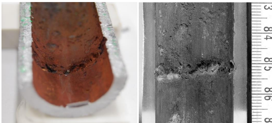
硫酸イオンによる給水ノズルの腐食