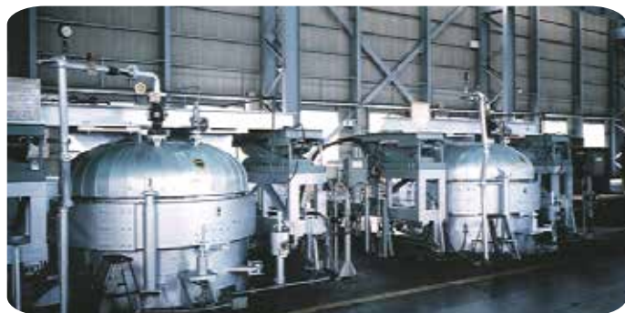
ジャケット式 高圧含浸缶

クラッチリング開閉式圧力容器：オートクレーブの分野においてNo.1の信頼性。 加圧・水熱のキーワードが御座います設備をご検討の際には是非御一報下さい。