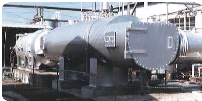
プロセス熱回収 煙管式排ガスボイラ

大阪ボイラーは創業以来、熱エネルギーの有効利用に取り組んできました。 排熱回収ボイラをはじめ、熱媒ボイラや過熱蒸気ボイラなど各種多様なご提案を致します。