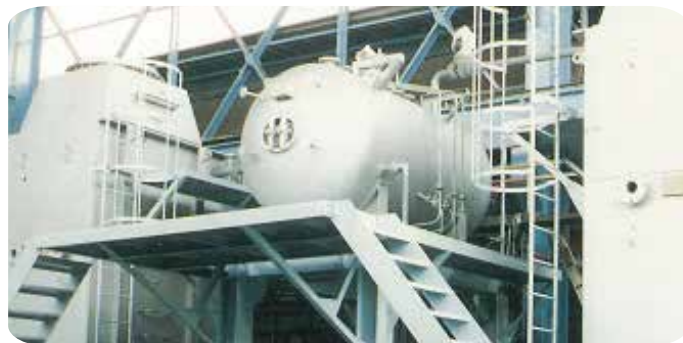
省エネ対応 強制循環式水管ボイラ